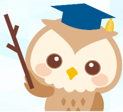
不動産のふくろう博士